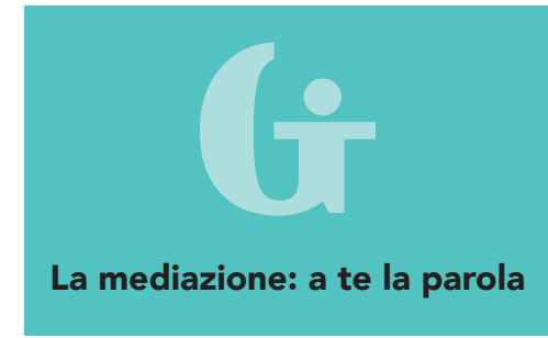
Illustrazione: Ilaria Orzali Design by Pringo.it

Raccontare quello che hai vissuto, dire ciò di cui hai bisogno, comprendere ciò che è accaduto e trovare vie possibili di riparazione. È una possibilità per superare il passato e cercare strade per stare meglio.